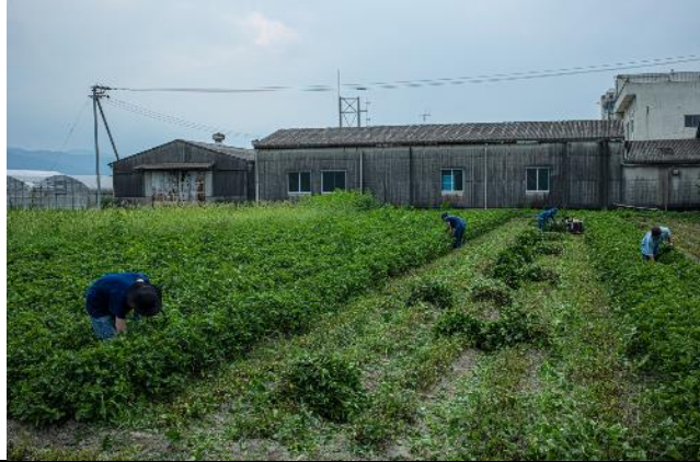
BUAISOU 在德島的蓼藍農地