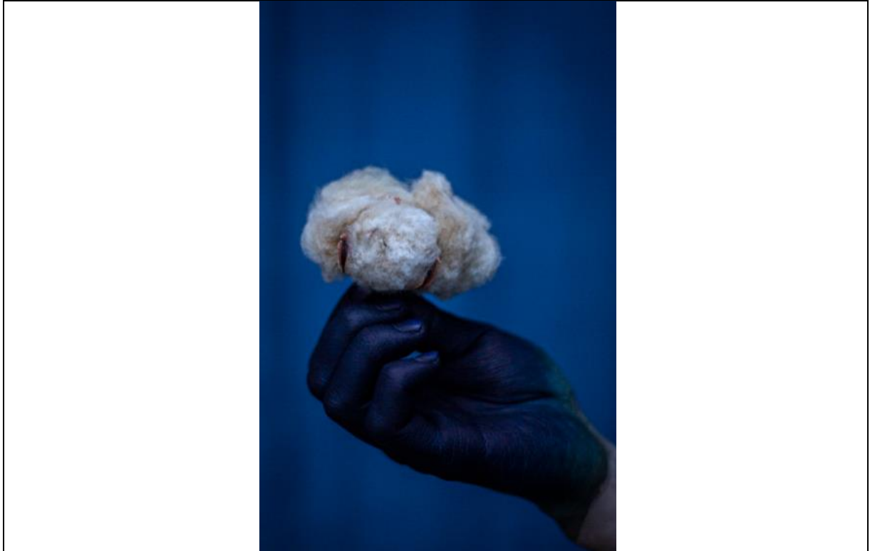
藍染匠人手執棉花