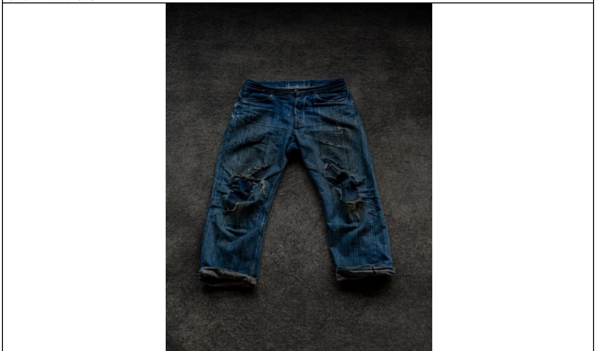
BUAISOU 牛仔褲