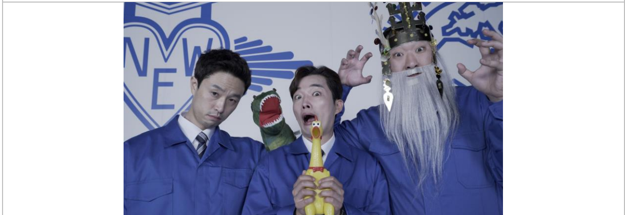
金滉 · 《棒棒噠市場》 · 2021