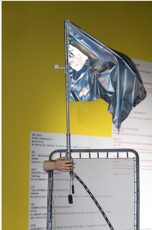
郭城 · 《風的驗證》 · 2021