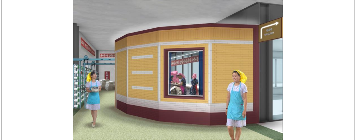
空解 (設計) 事務所的《棉紡》設計師概念圖 (2021)