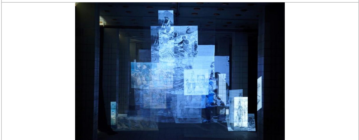
王雅媛 · 《我們與他們》 · 2019