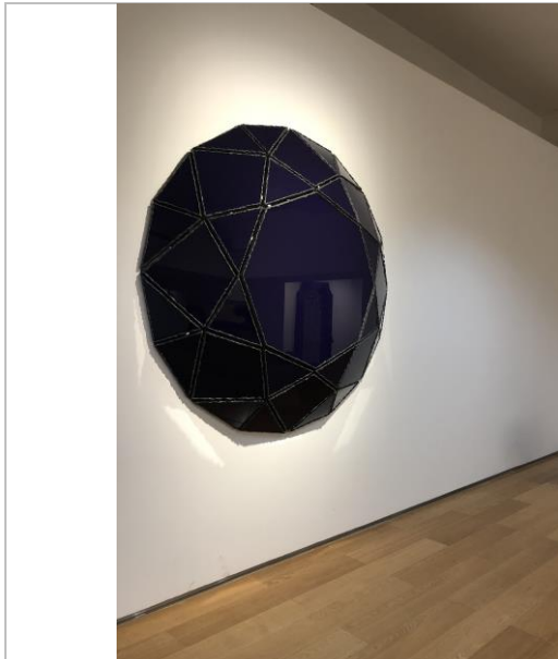
尹秀珍 · 《黑洞系列 4 號》 · 2019 藝術家提供