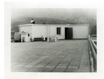
舊相片（南豐紗廠一廠天 台）1955