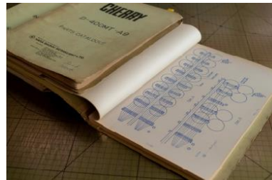
「櫻桃」併條機操作說明書 （Cherry D-400MT · 日本 Hara Shokki Seisakusho 製），1986 · CHAT 六廠藏 品，香港