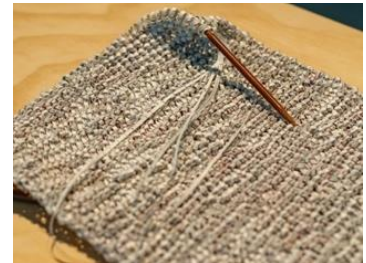
陳麗雲，《Fabric of CHAT》，2019 · CHAT 六廠藏品，香港