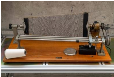
繞線板（南豐紡織有限公 司），1997 · CHAT 六廠藏 品，香港