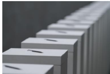
黃榮法，《時·針系列》， 2016 - 現在，CHAT 六廠藏 品，香港